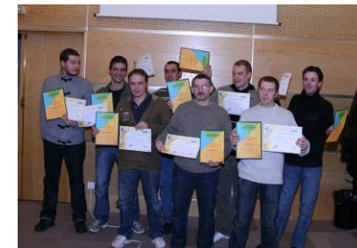
Remise de CQP / CQPI promotion 2009