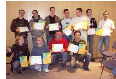
Remise de CQP / CQPI promotion 2008

2010 : 8 stagiaires en cours de formation